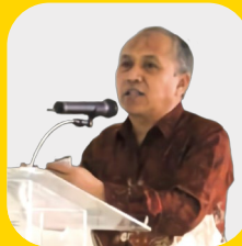
Pembina Yayasan dr. Suherman MKM

Bismillahirrahmanirrahim. Saya bercita-cita menjadikan fasilitas Salsabila untuk menjadi tempat pendidikan dan pelatihan bagi anak-anak, generasi yang akan menggantikan profesi sebagai dokter. Tantangan sebagai dokter ke depan sangat berat, terutama berhadapan dengan precision medicine dan juga personaliz medicine. Membutuhkan keahlian yang sangat luar biasa, kompetensi yang didukung oleh akhlakul karimah dan juga kemampuan untuk mempelajari berbagai multi bahasa, serta pemahaman tentang Al-Quran. Karena dengan Al-Quran, insyaallah semuanya akan terbuka lebar untuk menjadi dokter masa depan yang akan berbakti bagi keluarga, nusa, bangsa dan agama.